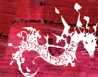
Illustration : Marion Durand Gasselini • maquette-impression : Kallima 07 Atlas